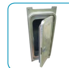
Огнестойкая дверца Артикул 33081220