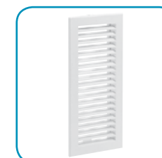
Решётка для вентканала Артикул 33101220